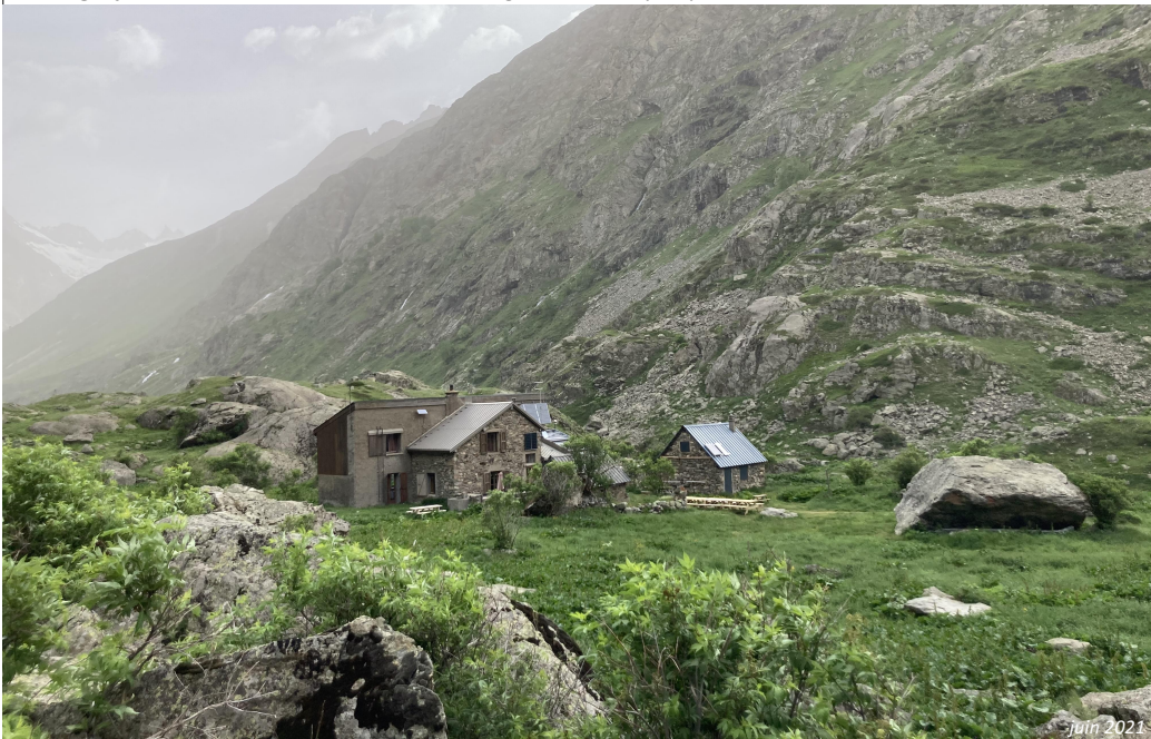
Photographie n°4, vue du hameau et du refuge de la Lavey depuis le Sud-Ouest