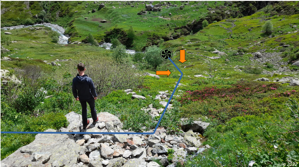
Photographie n°2, vue du tracé de la conduite forcée enterrée, depuis la prise d'eau