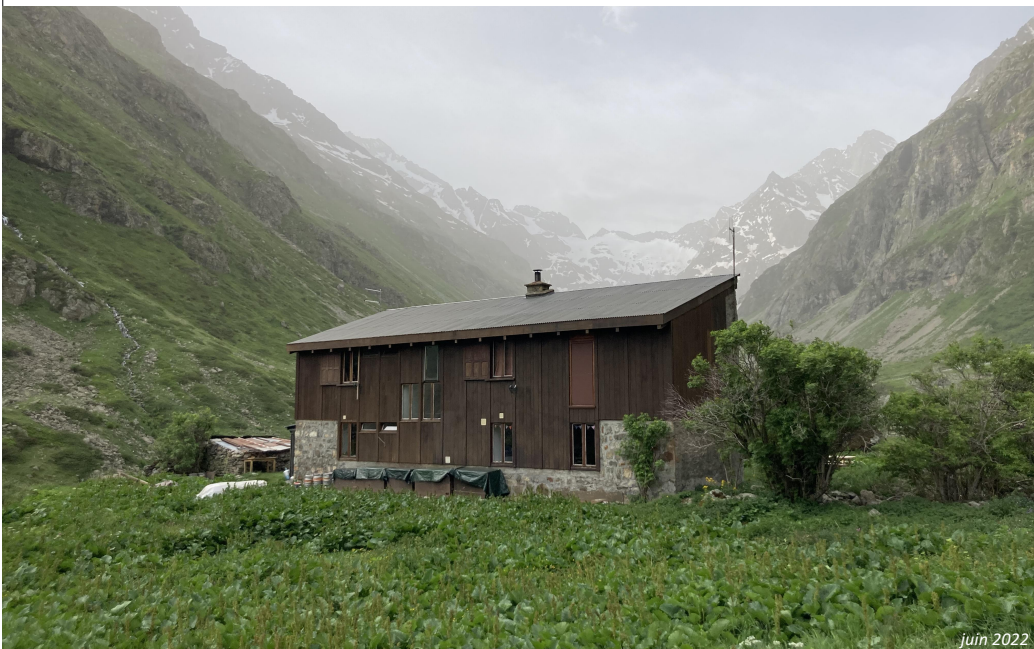
Photographie n°3, vue de "l'extension de 1968" du refuge de la Lavey, depuis le Nord-Ouest