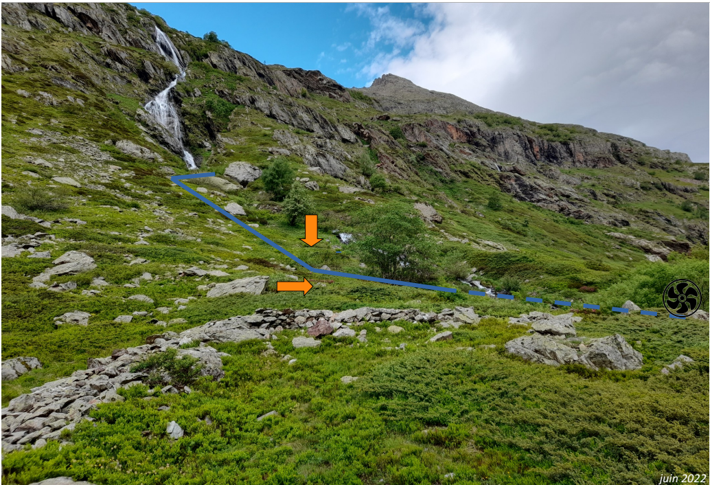
Photographie n°1, vue du tracé de la conduite forcée enterrée, depuis le sentier